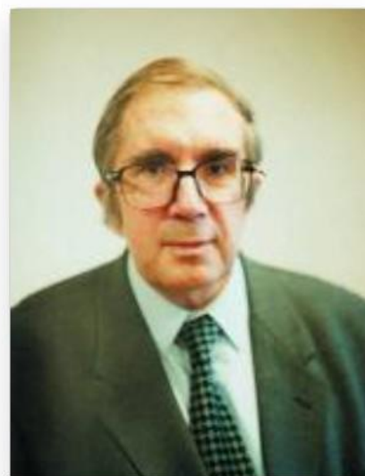
Сергей Сергеевич АВЕРИНЦЕВ 1937 – 2004