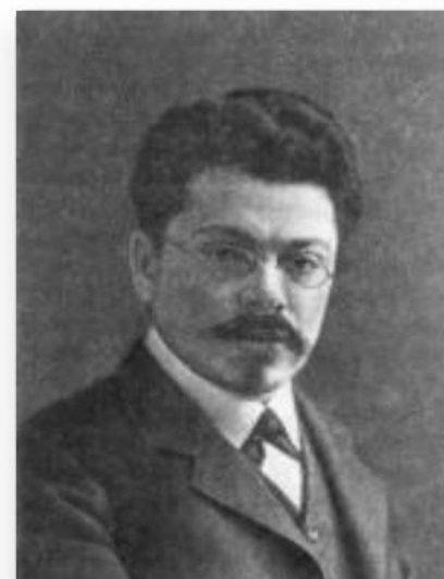
Юлий Исаевич АЙХЕНВАЛЬД 1872 – 1928